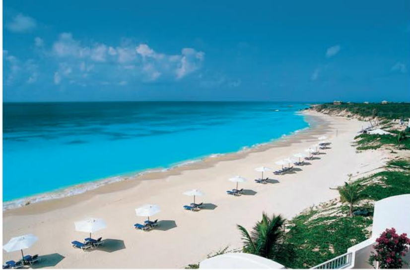
Dall'alto, in senso orario: la spiaggia del