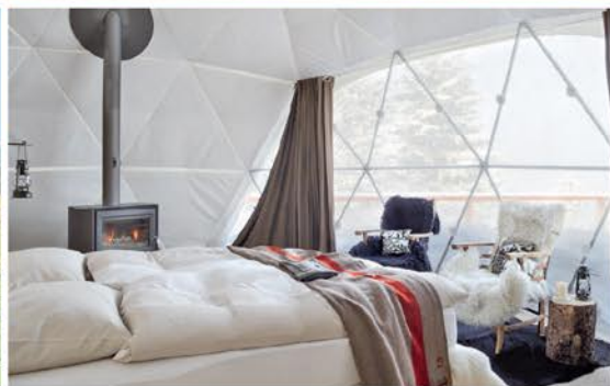
CuisinArt di Anguilla, le tende del Wildman Wilderness Lodge, nel Northern Territory in Australia, il Whitepod, in Svizzera, la nuova Overwater Serenity Wedding Chapel del Grande St. Lucian e una vista dei cottage del resort.

Hotels of the World , è stato pensato per sostenere le popolazioni locali. Grazie alla Fondazione Sumba infatti i profitti dell'albergo vengono in parte devoluti in progetti per il sostegno e lo sviluppo della comunità. In tema honeymoon, il re-